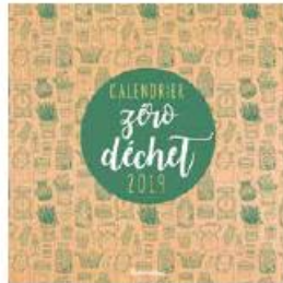
Calendrier zéro déchet 2019 Rustica | 9,95 €