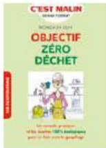
Objectif zéro déchet Leduc.s | 17 €