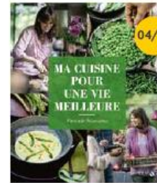
Ma cuisine pour une vie meilleure - Dascale Naessens Solar | 31,40 €