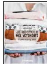
Je recycle mes vêtements Dessain et Tolra | 11,15 €