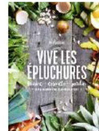
Vive les épluchures cuisine, cosméto, jardin Tana | 14,90 €