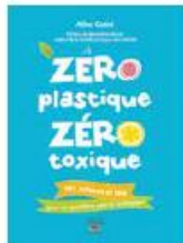
Zéro plastique, zéro toxique Thierry Souccar | 13,90 €