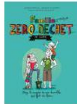
Famille presque zéro déchet ze guide Thierry Souccar | 15 €