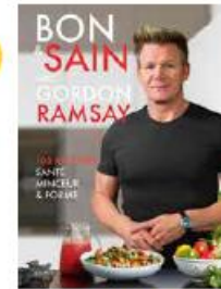
Bon et sain Gordon Ramsay Hachette | 29,05 €