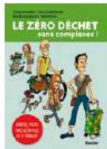
Le zéro déchet sans complexe! Racine | 19,95 €