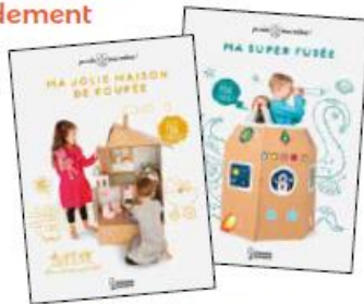
Ma jolie maison de poupée Ma super fusée Larousse | 6,70 €/livre